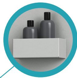
držala za čistila in držalo za pribor za čiščenje