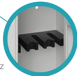
držalo za orožje iz trde pene